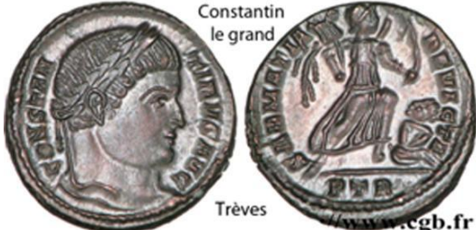
Constantin le grand